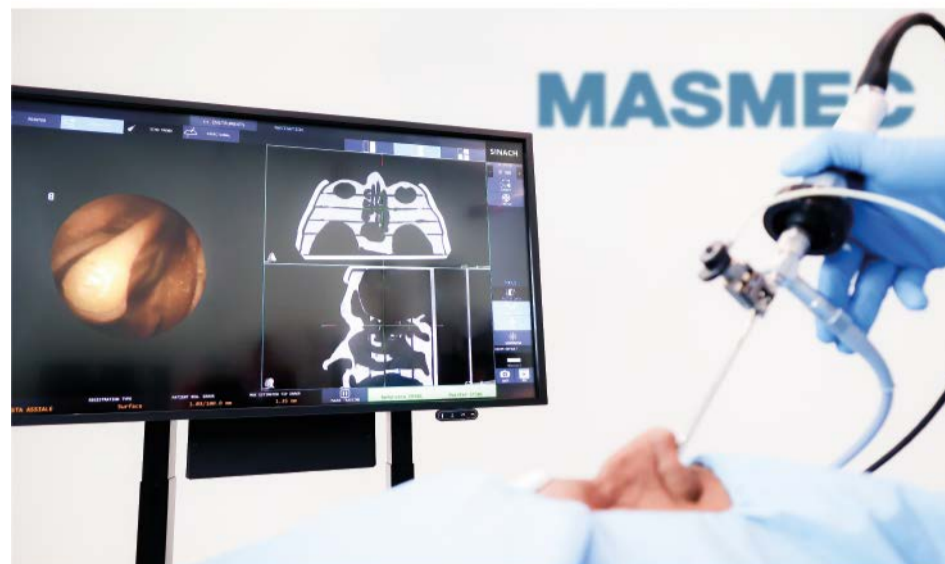
Esempio di tracciamento elettromagnetico in un contesto interventistico ENT simulato.

Al fine di migliorare l'ergonomia del sistema di navigazione e agevolare le procedure interventistiche, è stato studiato, realizzato e sperimentato un generatore di campo magnetico che può essere posizionato a una distanza maggiore (1 metro) dal paziente rispetto a quella comune.