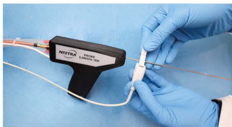
Applicatore del sistema di termoablazione con sensore di tracciamento.

Nel corso del progetto SINACH è stato studiato e realizzato un innovativo sistema per la termoablazione a microonde di una lesione tumorale. L'applicatore è equipaggiabile con un sensore di tracciamento ottico o elettromagnetico che gli permette di essere navigabile.