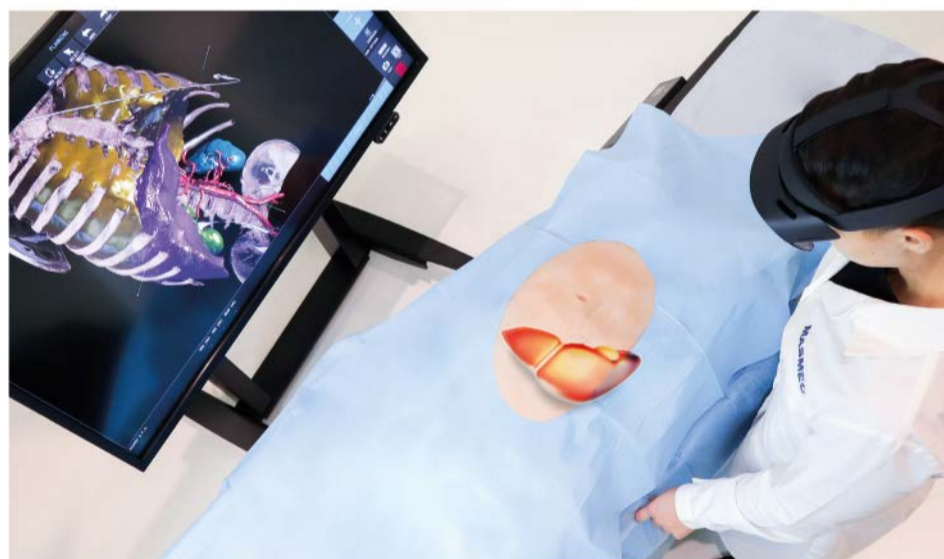
Applicazione di realtà aumentata su distretto epatico.

La realtà aumentata consente di sovrapporre il campo visivo virtuale con quello reale e permette di osservare un'area anatomica oltre l'ostacolo rappresentato dalla cute integra del paziente.